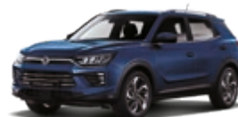
Dandy Blue (BAS)*