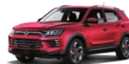
Cherry Red (RAV)*