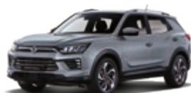
Platinum Gray (ADA)*