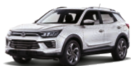
Grand White (WAA)